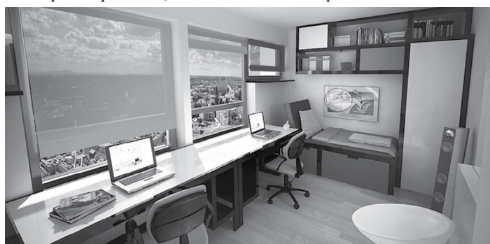
Студенческое общежитие мечты