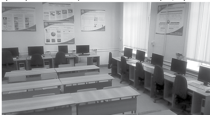
Обновленный компьютерный класс