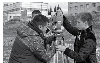
Работа с теодолитом

леджа отметила: «Для любой команды важно завоевать призовое место хотя бы в одной номинации. По итогам первого конкурсного дня мы стали лидерами в турнирной таблице.