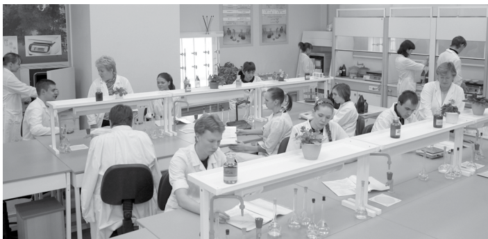
Современная лаборатория технического анализа

После 1928 года в связи с расширением контингента и спектра специальностей возникла потребность в соб-