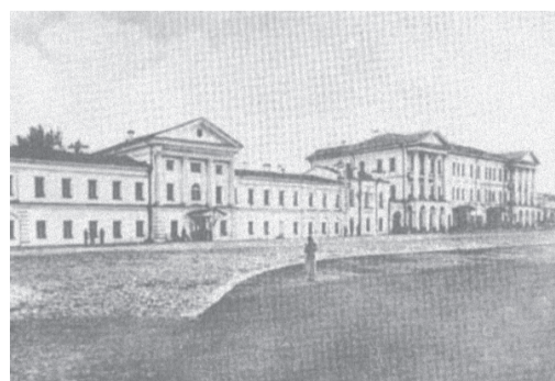
Второе здание Уральского горного училища

Училище выстояло в вихре исторических событий начала XX века, а в январе 1918 года решением специального заседания педагогического совета было преобразовано в Уральский рабочий политехникум. Опять открылась новая страница в истории нашего колледжа, и вы познакомитесь с ней в следующем номере газеты.