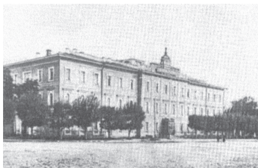
Первое здание Уральского горного училища