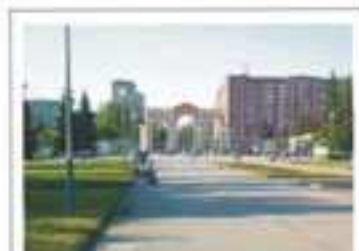
Центральный парк культуры и отдыха