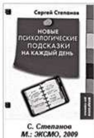
С. Степанов М.: ЭКСМО, 2009

Книга состоит из множества миниочерков по широкому кругу психологических проблем. Материал сгруппирован в несколько небольших разделов под названиями "Стремления. Цели. Ценности", "Среди людей", "Ума палата" и др. Каждого преподавателя, вероятно, особо заинтересуют разделы, названия которых говорят сами за себя: "Детский мир" и "Школа жизни". Здесь каждый фрагмент похож на те "изюминки", которыми любят шпиговать "тесто" своих сочинений авторы психологических пособий и учебников. Только здесь этого изюма целая пригоршня, начинающие "пекари". Именно этим книга может оказаться интересной и полезной "широкому кругу читателей".