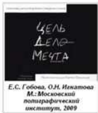
Е.С. Гобова, О.Н. Ивнатова М.: Московский полиграфический институт, 2009

Хорошо, что эта книга есть: достойный финал авторских трудов и отличный материал для читательских размышлений.